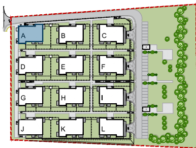
SCHEMAT LOKALIZACJI BUDYNKU