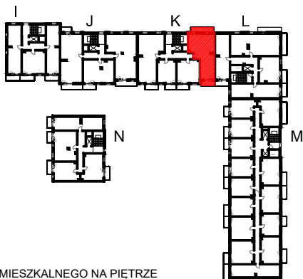
SCHEMAT LOKALU MIESZKALNEGO NA PIĘTRZE

Schematy mają charakter jedynie poglądowy. W przypadku ewentualnych rozbieżności pomiędzy schematem a projektem budowlanym, wiążący jest projekt budowlany.