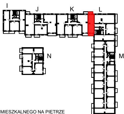
SCHEMAT LOKALU MIESZKALNEGO NA PIĘTRZE

Schematy mają charakter jedynie poglądowy. W przypadku ewentualnych rozbieżności pomiędzy schematem a projektem budowlanym, wiążący jest projekt budowlany.