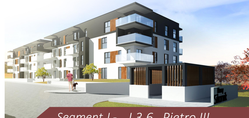
Segment J - J.3.6 Piętro III