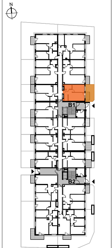
USYTUOWANIE MIESZKANIA NA KONDYGNACJI