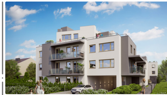
Widok od strony ulicy