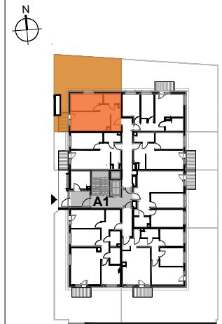
USYTUOWANIE MIESZKANIA NA KONDYGNACJI