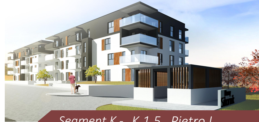
Segment K - K.1.5 Piętro I