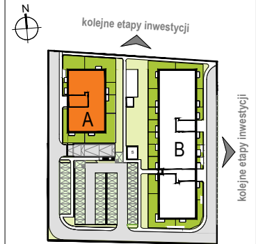
LOKALIZACJA BUDYNKU NA DZIAŁCE