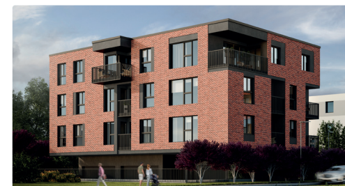
Widok na budynek