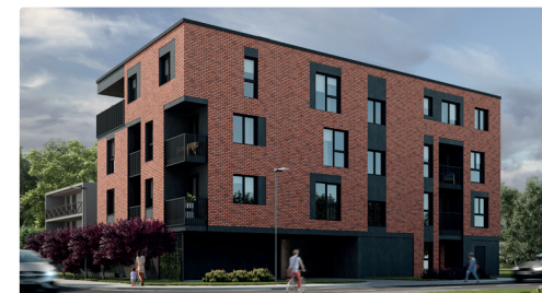
Widok na budynek

Zapewnione miejsce dla samochodu na platformie