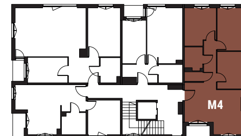
Rzut I piętra