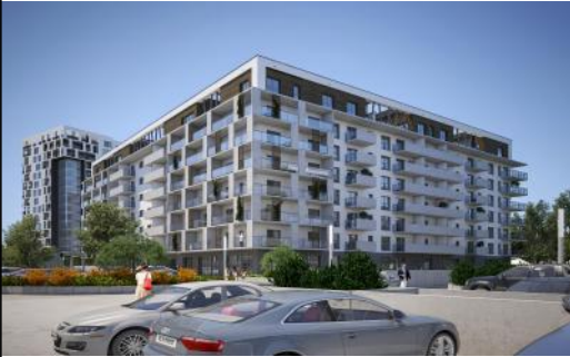
Lokal usługowy nr 2