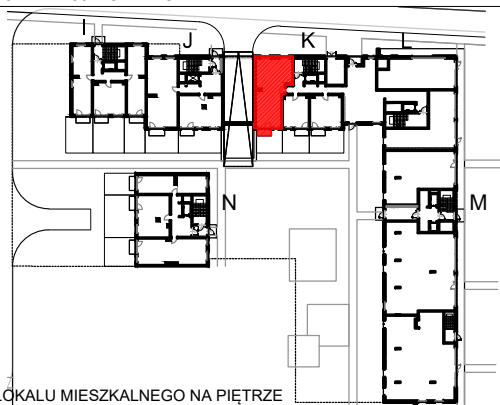
SCHEMAT LOKALU MIESZKALNEGO NA PIĘTRZE

Schematy mają charakter jedynie poglądowy. W przypadku ewentualnych rozbieżności pomiędzy schematem a projektem budowlanym, wiążący jest projekt budowlany.