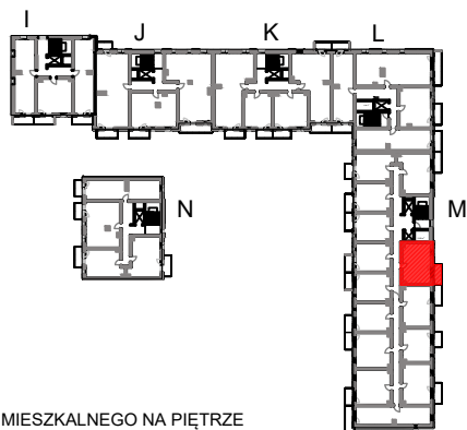
SCHEMAT LOKALU MIESZKALNEGO NA PIĘTRZE

Schematy mają charakter jedynie poglądowy. W przypadku ewentualnych rozbieżności pomiędzy schematem a projektem budowlanym, wiążący jest projekt budowlany.