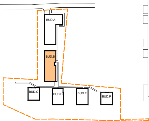
SCHEMAT LOKALIZACJI BUDYNKU