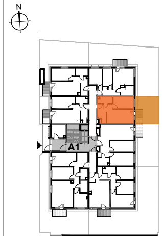
USYTUOWANIE MIESZKANIA NA KONDYGNACJI