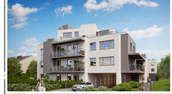
Widok od strony ulicy