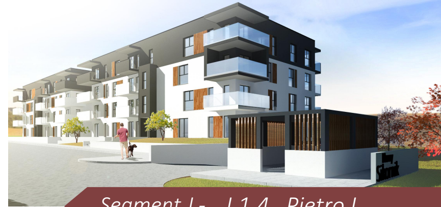
Segment J - J.1.4 Piętro I