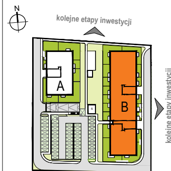
LOKALIZACJA BUDYNKU NA DZIAŁCE