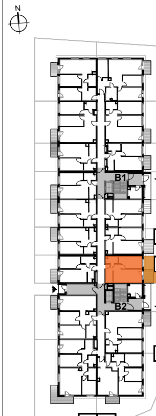
USYTUOWANIE MIESZKANIA NA KONDYGNACJI