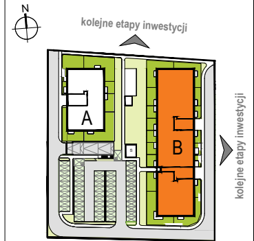
LOKALIZACJA BUDYNKU NA DZIAŁCE