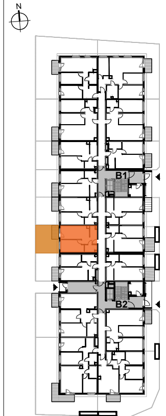
USYTUOWANIE MIESZKANIA NA KONDYGNACJI