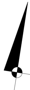
LOKALIZACJA LOKALU NA RZUCIE I PIĘTRA skala 1:500