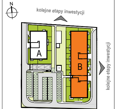
LOKALIZACJA BUDYNKU NA DZIAŁCE