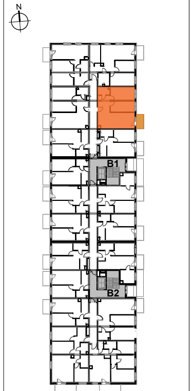
USYTUOWANIE MIESZKANIA NA KONDYGNACJI