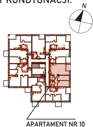
APARTAMENT NR 10