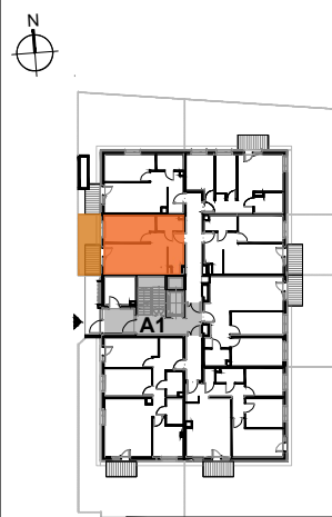
USYTUOWANIE MIESZKANIA NA KONDYGNACJI