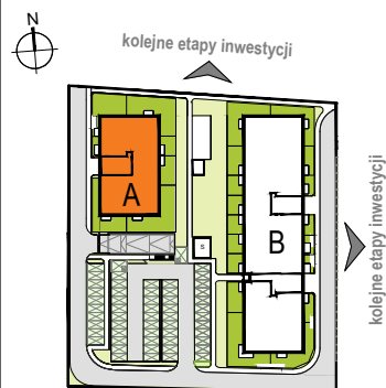
LOKALIZACJA BUDYNKU NA DZIAŁCE