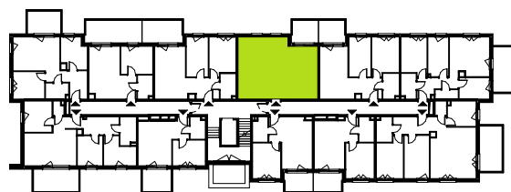
RZUT KONDYGNACJI II PIĘTRO

ul. Inżynierska 78, 81-512 Gdynia 58 664 88 37 58 664 87 97 targo@targo.com.pl