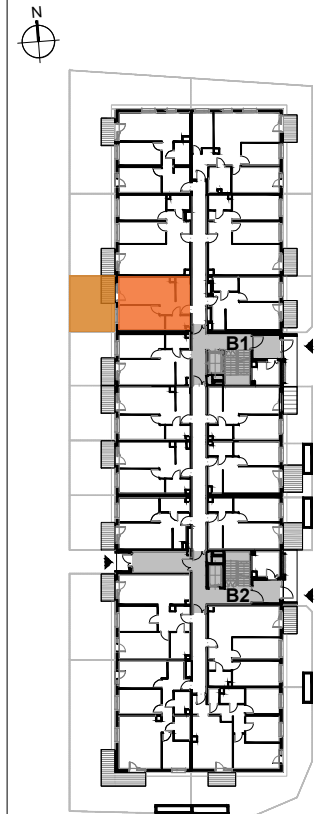
USYTUOWANIE MIESZKANIA NA KONDYGNACJI