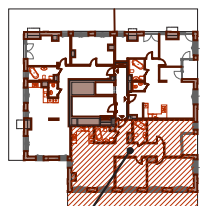
APARTAMENT NR 56