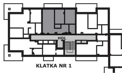
KLATKA NR 1