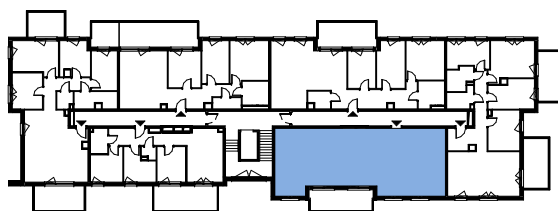
RZUT KONDYGNACJI V PIĘTRO

ul. Inżynierska 78, 81-512 Gdynia 58 664 88 37 58 664 87 97 targo@targo.com.pl