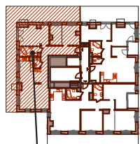
APARTAMENT NR 54