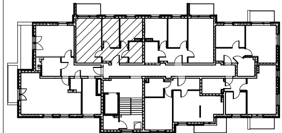
Zestawienie pomieszczeń - AM22