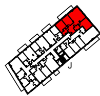
SCHEMAT LOKALIZACJI MIESZKANIA W BUDYNKU