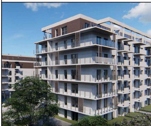
MIESZKANIE NR 48